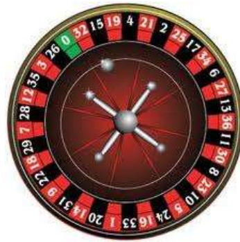
ヨーロピアン・タイプ (37 数字)