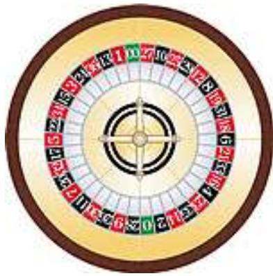
アメリカン・タイプ (38 数字)